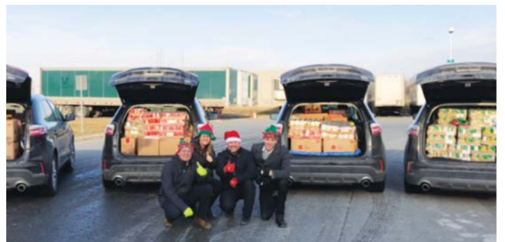
▲ 팀을 구성해 푸드뱅크에 전달할 식료품을 가득 싣고 포즈를 취하는 JTI 직원들.

9년 전 그녀가 살고 있는 지역 푸드뱅크에 관한 뉴스를 보게된 그녀는 곧바로 팀을 꾸려 기업 차원에서의 불우이웃 돕기 기부행사로 확대시키 나갔다. “지역 총책이 당시 내 생각을 흔쾌히 받아들였고 본사에까지 보고가 됐다. 그리고 전사적 차원으로 캠페인이 확산됐다.” 그녀는 JTI에서 마케팅 부서 직원으로 경력을 시작했다. 자신의 작은 아이디어가 회사 차원에서 커다란 캠페인으로까지 발전한 것에 대해 놀랍고 대견함을 느끼고 있다.