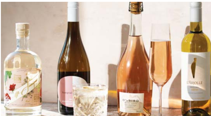
▲ Clearships사가 강력히 추천하는 무알콜 음료들

투스 회장은 “편의점 업주들이 깔끔한 외관의 무알콜 진열 섹션을 따로 장만해 이들을 잘 진열하면 좋은 결과가 있을 것”이라고 권하는데 주력 아이템으로 무알콜 화이트 와인, 비어, 완성품 칵테일이 가장 좋다고 한다. 손님들이 이 제품들을 사서 냉장고에 보관해 시원하게 해서 마시면 최적의 맛을 즐길 수 있다는 말도 덧붙였다.