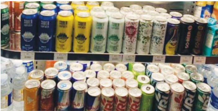
▲ 파크랜드 편의점 채널망에서 인기몰이 중인 무알콜 음료 진열 모습. 시음을 통한 소비자 호평을 확인 후 전 매장에서 판매 중이다.

투스 회장은 “편의점 업주들이 깔끔한 외관의 무알콜 진열 섹션을 따로 장만해 이들을 잘 진열하면 좋은 결과가 있을 것”이라고 권하는데 주력 아이템으로 무알콜 화이트 와인, 비어, 완성품 칵테일이 가장 좋다고 한다. 손님들이 이 제품들을 사서 냉장고에 보관해 시원하게 해서 마시면 최적의 맛을 즐길 수 있다는 말도 덧붙였다.