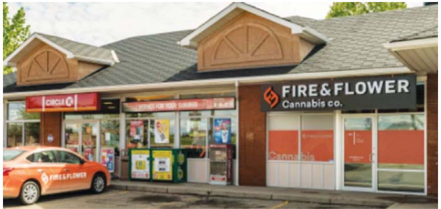
▲ 서클케이와 F&F는 같은 공간에 이웃하며 영업을 하며 양쪽 고객들의 트래픽을 상호 공유하는 시너지 전략을 구사하고 있다.

Fire & Flower라는 소매체인사가 있다. 실험뉴스에서도 최근 몇년간 몇차례 소개한 바가 있는데 기호용 마리화나 전문취급 유통사다. 회사의 정식 명칭은 Fire & Flower Holdings Corp.(이하 'F&F')인데 편의점 지존 쿠쉬타르(Alimentation Couche-Tard Inc.)와 깊은 연관이 있다. 두 회사가 끈끈한 제휴하에 사세를 확대해왔다. 쿠쉬타르는 지난 2020년 여름에 이 회사에 2,600만 달러를 투자하면서 약 10%의 지분을 확보했다. 2019년에 F&F는 23개의 업소를 운영했고 이후 계속 지점을 오픈해 2020년에는 50개를 넘기고 있었다.