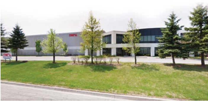
▲ 25만 평방피트의 대규모 물류 기지를 가지고 ‘독립 도매상의 도매상’이라 일컬어지는 잇월(ITWAL). 본사와 물류 센터가 함께 있다.(440 Railside Dr, Brampton, ON)

‘잇월(ITWAL)’이라는 전국 단위의 식품 도매유통 네트워크가 있다. 공식명칭은 ‘ITWAL Limited’인데 보통 간단히 잇월로 통한다. 식품유통업이 대형 식품 체인사에 의해 지배되는 구조를 깨고 독립 식품 도매상들끼리 힘을 모으자는 취지에서 1966년에 발족한 단체다. 지난 수년간 이 단체는 많은 공급사들과 강력한 유대관계를 뿌리내리며 협력 활동을 왕성하게 벌여왔다. 제휴한 공급사들은 지역사회 기여 활동에 큰 관심을 가지고 있는데 이의 가교역할을 ITWAL이 자임했다. 지난해 금전 및 현물 기부 캠페인을 수차례 벌였고 제휴한 14개 공급사의 적극적 지원하에 전국 편의점주간(National Convenience Week)을 성대히 치렀다. 편의점주간 행사에서도 기금마련 캠페인을 벌인 것은 물론이다. 이 행사는 코비드-19 이전인 2019년부터 개최해왔는데 편의점 채널에서 공급사의 중요성을 인식시키는 계기로도 활용됐다.