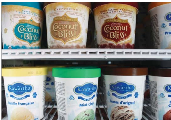
▲ 커피를 비롯한 취급 품목들이 온타리오나 토론토 지역 특화 제품들이다.

고객만족을 철학으로 삼은 결과, 손님들의 고객 충성도가 확실하게 자리 잡았다. 재사용 머그잔 사용 고객에 대한 보상 프로그램(포인트 적립)을 도입했다. 물론 손님들의 판매액에서 일정 몫으로 포인트 적립이 병행됐다. 매출도 오르고 고객 충성도 확보에 친환경정책을 선도하는 착한 업소 이미지 정립도 되니 도대체 커피 한 아이템을 가지고 몇가지 효과를