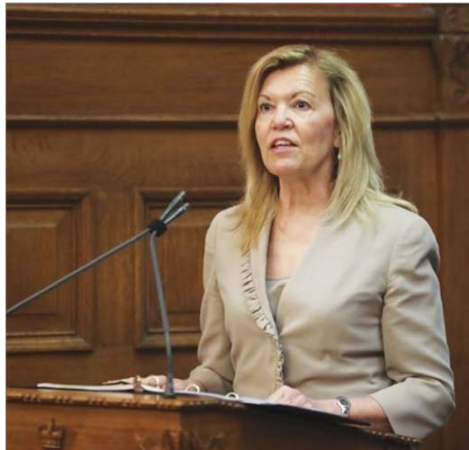
▲ 크리스틴 엘리엇(Christine Elliott) 온주 보건부 장관이 지난 10월 25일 편의점에서의 전자담배 판촉 광고를 금지하는 정책을 발표해 업계에 큰 실망감을 안기고 있다.

이미 이전 자유당 정권하에서부터 편의점에서의 베이핑 제품 광고 금지 조치가 내려질 예정이었던 것이다. 작년 7월 1일이 발효시점이었으나 그 전 달인 6월 7일 총선에서 정권이 보수당으로 교체된 직후 새 정부는 금지 관련 시행령 발효를 중단했다. 편의점에 숨통이 트이는 순간이었다. 그