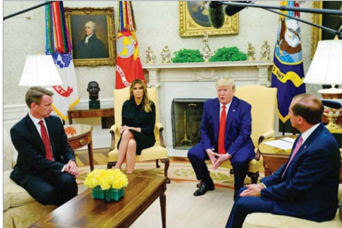
▲ 지난 9월 11일 도널드 트럼프 미 대통령이 향가미 베이핑 제품에 대한 판매 금지 정책을 발표했다. 퍼스트 레이디 멜라니 여사도 우려를 표명하며 정책에 힘을 보탤다. 현재 미국에는 성인 8백만 명, 미성년자 5백만 명이 베이핑 제품을 소비하는 것으로 알려져 있다.

한편, 최근 미국에서는 보건 당국이 베이핑과의 상관성을 보이는 질병 1,604건의 사례를 보고한 바 있으며 이 중 34건은 사망으로 이어졌다는 사실이 밝혀지면서 사회적으로 큰 파장을 일으켰다. 급기야는 트럼프 대통령이 “향가미 전자담배 판매 금지”를 직접 발표하는 상황까지 일어났다. 일각에서는 캐나다도 연방과 온주 정부가 나서 이처럼 예민한 반응을 보이는 것이 미국 상황과 무관하지 않은 것으로 보인다고 추측하고 있다.