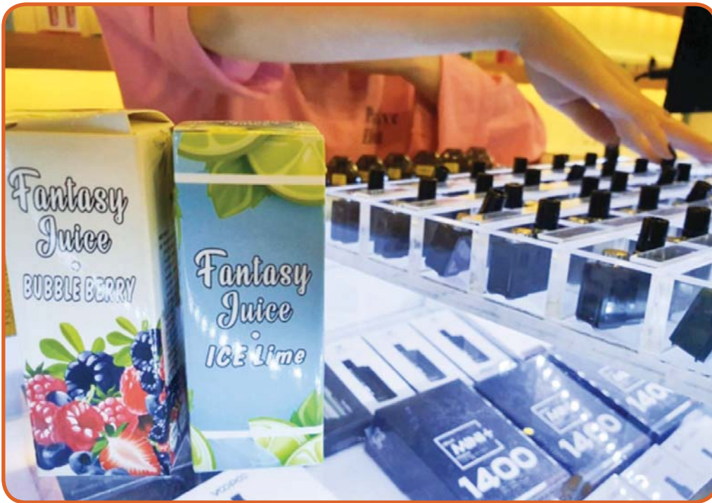
▲ 서울의 한 전자담배 전문 판매점에서 손님에게 액상형 전자담배 소개를 하는 모습.

모국 정부가 액상형 전자담배 소비를 중단하라고 권고하고 나섰다. 특히 청소년들에게는 '즉시' 사용을 중단해야 한다고 촉구했다. 폐질환과의 연관성이 크게 의심된다는 근거에서다.