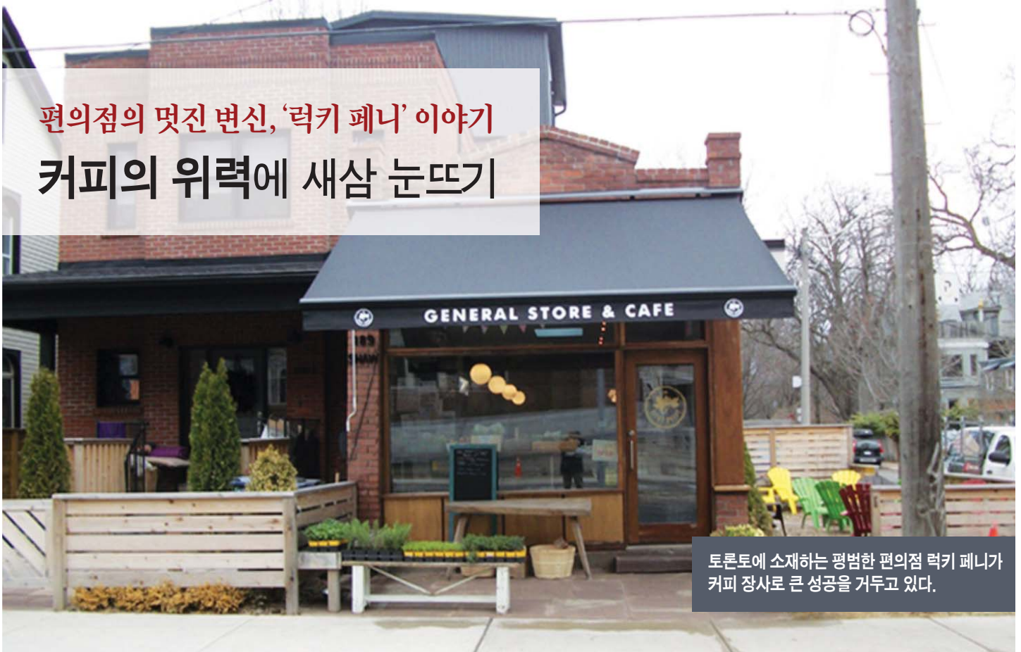
토론토에 소재하는 평범한 편의점 럭키 페니가 커피 장사로 큰 성공을 거두고 있다.

손님의 커피에 대한 경험을 근사하게 만들어주기 위한 노력은 결코 무시 못할 부수입으로 보답한다. 이는 편의점과 그 파트너인 유명 커피 체인사 둘이 동시에 입증해 보이는 바이다. 순전히 잠재적인 시장만 놓고 말하자면 커피를 통해 얻을 수 있는 기회라는 것은 무궁무진하다. 커피는 캐나다 성인들 사이에서 가장 많이 소비되는 식품이다. 아주 흔하고 손쉬운 소비재인데 다소 과장하자면 아마도 수도물보다 소비량이 더 많지 않을까... 국내 커피 시장은 62억 달러 규모이며 이는 결들인 푸드서비스 몫 480만 달러까지 보탬 수치가. 전국커피협회(Coffee Association of Canada)의 보고 통계다.