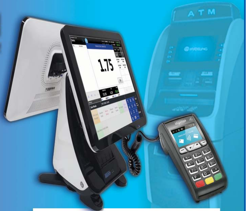
Debit & ATM and POS system

www.1solutions.ca / info@1solutions.ca Toll Free.1(888)554-7355 Korean(ext4) Direct Line.(905) 560-4511. (416)900-7533 Fax.1(888)554-0409