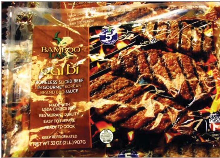
▲ 코스트코를 비롯한 대형 유통매장에서 쉽게 발견되는 한국 식품들. 짜짜면, 갈비, 양념한 불고기에서부터 라면은 기본이고 김까지 판매되지 오레다.

다양한 식품을 구비하고 있는 식품점에서 쇼핑하겠다고 밝히고 있다. 또, 5명 중 2명 꼴로 향후 특별한 음식이나 식재료를 구입할 계획이라고 답했다. 중국계 캐나다인들과 남아시아계 캐나다인들이 특히 이런 생각을 많이 가지고 있었다.