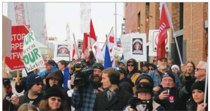
▲ TFW라고 해서 동남아에서 오는 인력만이 아니다. 미국에서도 많은 수의 TFW가 있었다. 사진은 금속 노조원들이 미국으로부터 오는 철강산업 일꾼들의 대거 채용에 대해 격한 시위를 벌이고 있는 2015년 2월 에드몬턴의 모습이다.

것이라고 공약했다. 전문가들은 케니가 공연히 노동 시장에 분란만 조장한다고 일갈했으며 이렇게 저임금으로 돌아가면 안그래도 사람 구하기 힘든 편의점 업계에 그나마 붙어있을 인력 불잡기가 더 어려워진다는 점을 지적했다. 지적한 그 대로 케니 수상은 집권했지만 임금 정책에서 어떤 변화를 주지 못하는 어정쩡한 상태에 놓여 있는 국면이다.