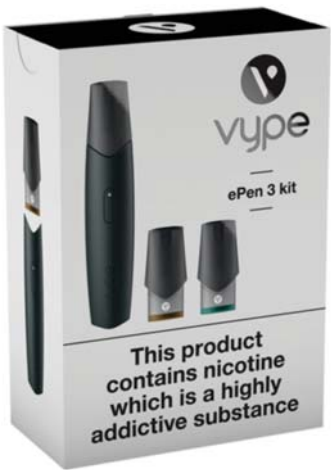
▲ 캐나다 최대 담배회사 임페리얼이 유통시키고 있는 간편급 베이퍼인 바이프(Vype)

이렇게 규격과 디자인이 무궁무진한 베이퍼이지만 베이핑 디바이스만 놓고 말하면 크게 두가지 타입으로 정리된다. 연방 보건부가 그렇게 압축 대별했는데 하나는 오픈 시스템(open system)으로 디바이스에 액상을 계속 채워주면서 사용하는 타입이다. (device to be refilled).