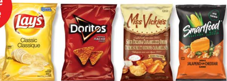
Lay's / Doritos / Miss Vickie's / Smartfood 2/$3