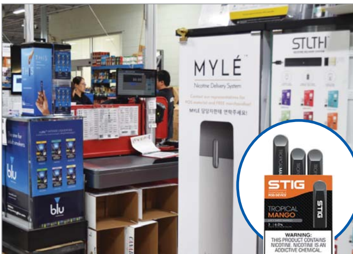
▲ 현재 협동조합에서는 주류 이외에도 블루, 마일리, 스틸스, 스티그 등 총 5개사의 인기 브랜드를 취급하고 있다.

연방 보건부가 베이핑이 일반 흡연보다 인체에 덜 해롭다는 것을 인식했음에도 불구하고 전국적으로 감시의 눈길이 예사롭지 않다. 심각한 우려들이 나온다. 우선 보건부도 베이핑이 니코틴 중독에 이르게 한다는 사실을 우려한다. 폐 손상 가능성도 있다고 한다. 다만 장기적으로 어떤 영향을 주는지를 아직 확인하기 어렵다는 입장이다.